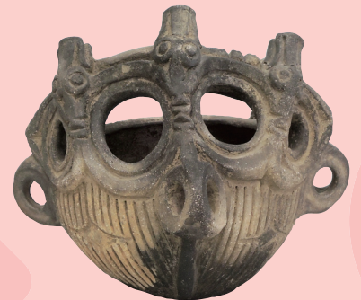
動物装飾付釣手土器 (諏訪市博物館)