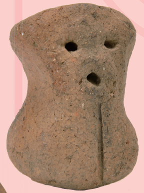
おやゆび姫 (茅野市尖石縄文考古館)

期間中は目切遺跡から出土した「壺を持つ妊婦土偶」をキャンペーン特設ブースで展示するほか、国重要文化財の海戸遺跡出土顔面把手付深鉢形土器など岡谷市内の縄文時代から平安時代の遺跡から出土した遺物を展示しています。