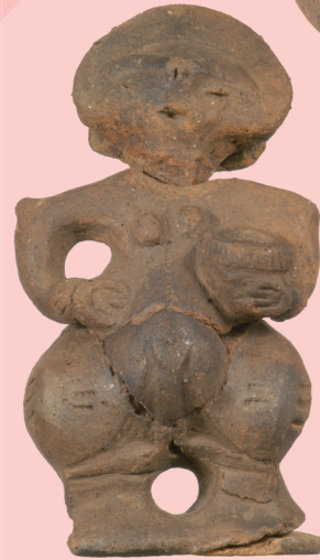
壺を持つ妊婦土偶 (市立岡谷美術考古館)

国史跡「阿久遺跡」から出土した、縄文時代前期の土器や石器、前尾根遺跡から出土した、県宝である顔面装飾付釣手土器を中心とした資料と共に、原村出身の清水多嘉示の彫刻や絵画、津金雀仙の書を展示しています。