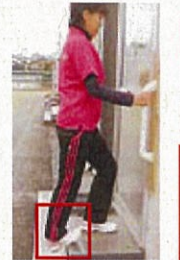
アキレス腱伸ばし