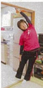
出入り口を利用して背伸び・胸そらし・胸伸ばし・背中伸ばし・片手で脇伸ばし