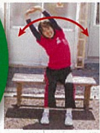
背伸び・体側伸ばし