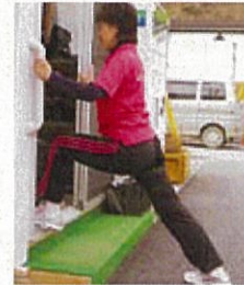
股関節とふくらはぎ