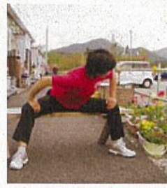
内ももと背中伸ばし