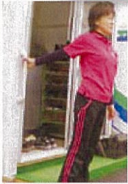
玄関の手すりを使って肩のストレッチ