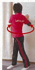
上体ひねり(左右・斜め上)