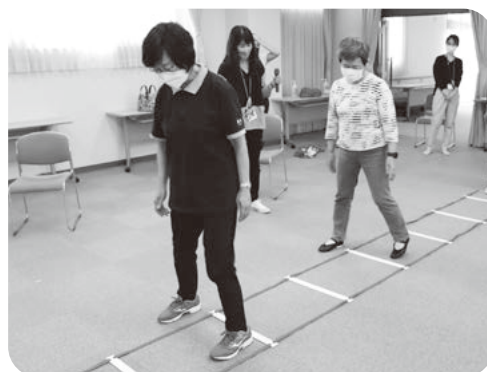
ステップをしながら脳を刺激

今後、地域の様々な場で、介護予防リーダーの目印のピンク色のポロシャツを着用し健康づくり、地域づくりのために活躍していただきます。