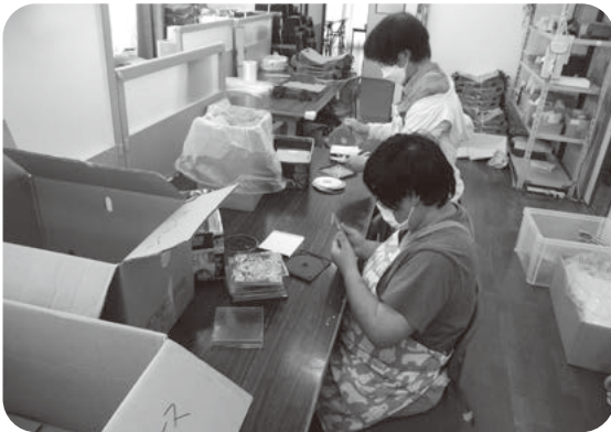
資源の再利用をめざして丁寧な作業