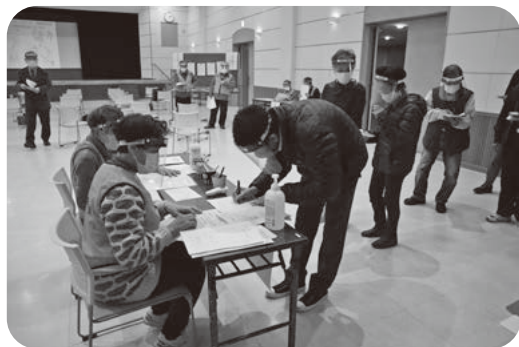
災害ボランティアコーディネーターフォローアップ講座

ボランティアセンターの運営 災害ボランティアコーディネーター養成講座 災害ボランティアコーディネーターフォローアップ講座