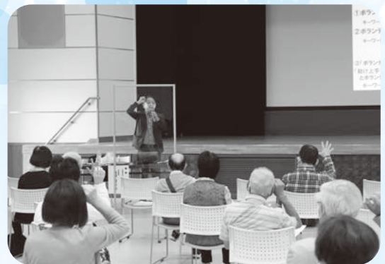
“ボランティア”は元気の秘訣!!

参加者からは「笑顔でボランティアをしていきたい」「生きがいとなるような活動を見つけたい」などの感想もあり、今後のボランティア活動のエネルギーをいただきました。