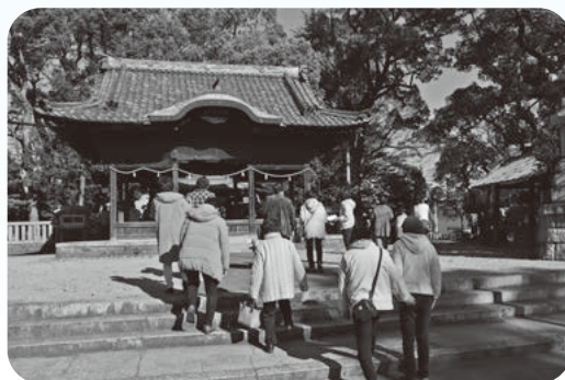
ふれあい交流会(ウォーキング)