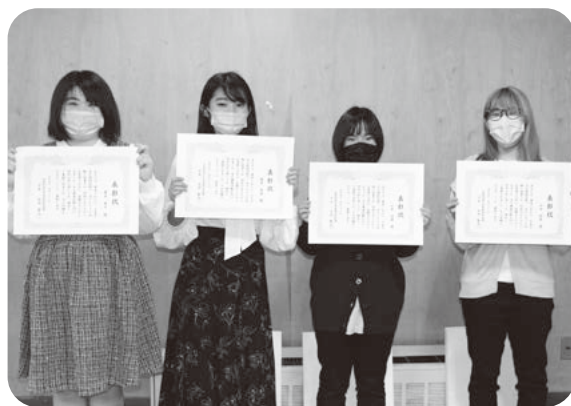
表彰状を受け取りました