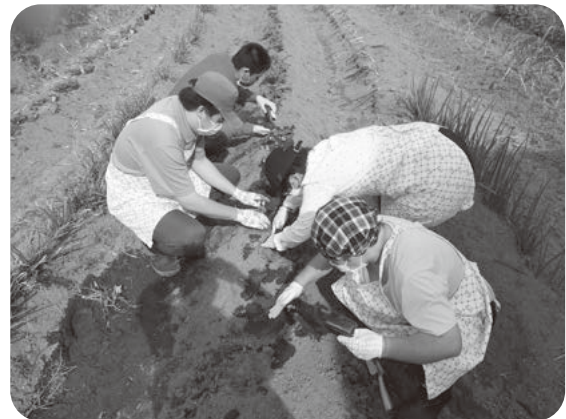
大きく育てるための徹底した草取り

収穫できた時には販売をしておりますので、授産所のホームページからご注文ください。電話での注文もできますので、小規模授産所(☎387-2469)までお気軽にお問い合わせください。取れた野菜をぜひ町民の皆さんに味わっていただきたいと思っています。