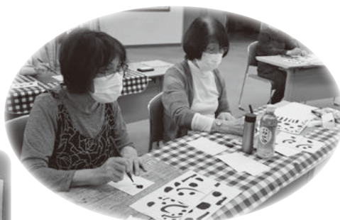
己書に初めてチャレンジ!