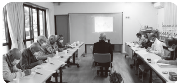
皆さん集中して取り組まれています

専用のDVDを観ながら解答用紙に答えを記入することで手先の運動機能や脳の様々な知的機能を測りました。参加された皆さんから「いろいろと覚えて答えるのが難しかった」「免許更新よりも難しく感じた」「以前もやったことがあるが、今回改めてやってみてよかった」などの感想がありました。今後も皆さんと一緒に認知症予防につながる活動を考えていきます。