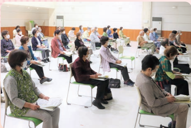
ボランティア活動の工夫について学びました