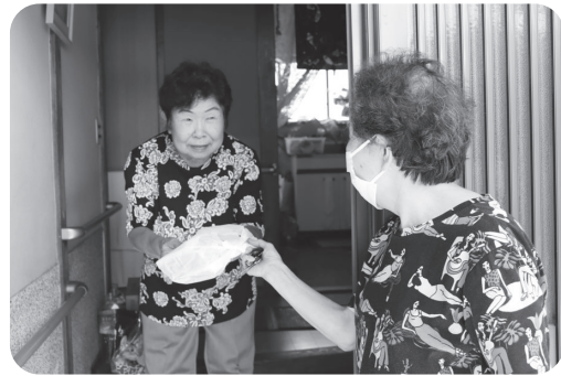
ひとり暮らし高齢者安否確認事業

ふれあい・いきいきサロン推進事業 ひとり暮らし高齢者向け情報紙「えがお」の発行(毎月) ひとり暮らし高齢者配食サービス ひとり暮らし高齢者安否確認事業