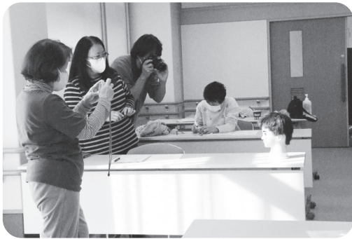
広報活動ボランティア養成講座

ボランティアセンターの運営 広報活動(カメラ)ボランティア養成講座 災害ボランティアコーディネーター養成講座