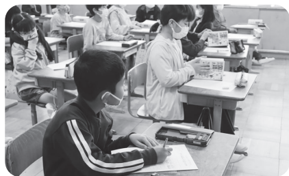
福祉について辞典も使って調べます

今年1年間、子どもたちに様々な体験を通して「福祉」について学ぶきっかけづくりを行います。