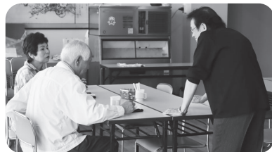
他町内からも参加してくれました