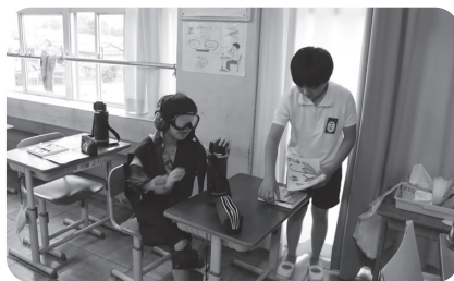
普段の動きと何が違うかな