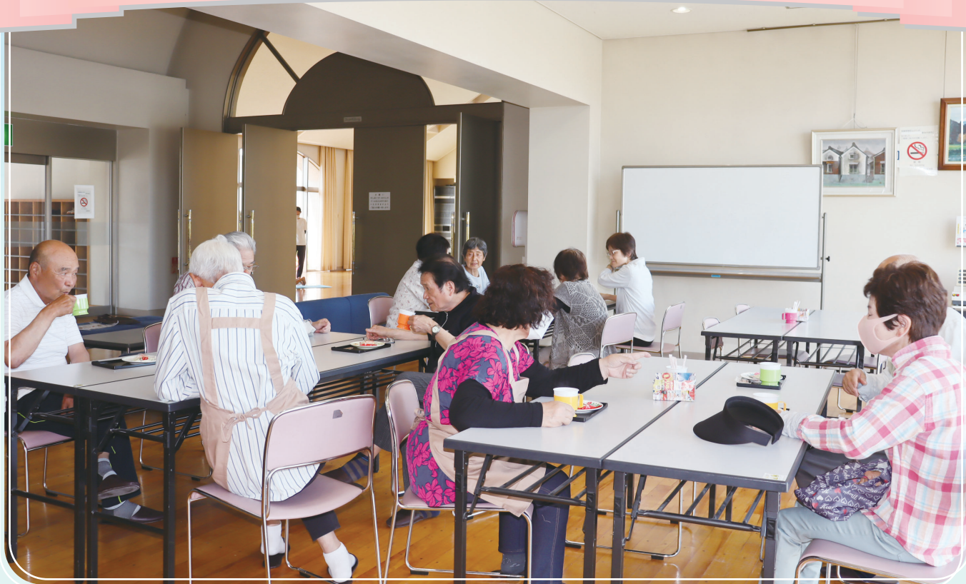
久々の再会に話がはずみます