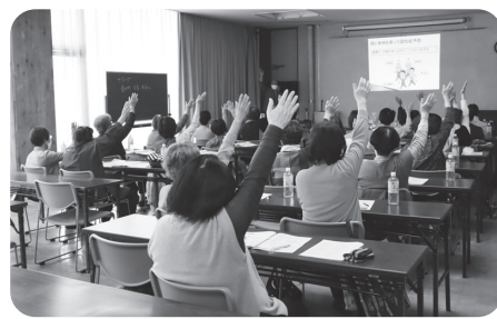
認知症や予防について学びました

認知症サポーター養成講座は、企業や学校への出前講座も可能です。ご希望の際は本センターまでお問合せください。