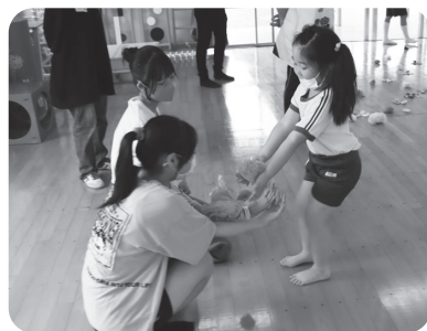
お花いっぱい集めたよ

6月10日(土)にボランティアグループKindのメンバー16人が、松枝保育所の園児との交流会を行いました。コロナで交流会ができなくなり、一昨年と昨年はKindで手作りをしたおもちゃをプレゼントしていましたが、今回は3年ぶりに交流会の開催です。メンバーは園児との交流を楽しみにしながら5月から遊びを考え一生懸命準備をしていました。当日は、アンパンマンやディズニーの手遊びうた、折り紙で作った花を色ごとに集めるお花摘みゲームをして遊びました。短い時間でしたが、笑顔と賑やかな笑い声がいつぱいのとても楽しいひと時になりました。