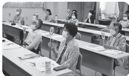
‘もしも’に備える防災クイズ(昨年度)