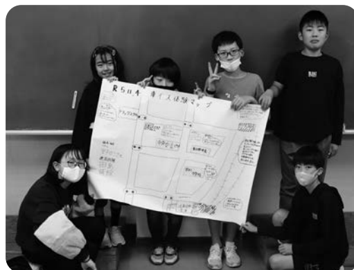
完成した「車いす体験マップ」

体験後、参加者は「自転車が停めてあると道がせまくて車いすでは通りづらかった」や「スロープがあり、なめらかで通りやすかった」などの意見を話し合い、「車いす体験マップ」を作成しました。