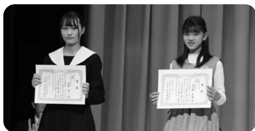
福祉メッセージ大賞者の表彰

*フレイルとは健康な状態と要介護状態との間の虚弱な状態にあることです。早期に見つけて、適切な対策をすれば、再び健康な状態に戻ることができます。