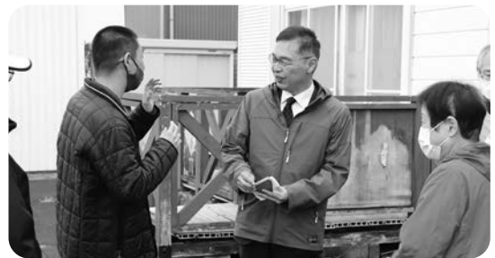
町長さんとお話できました

授産所ではアルミ缶を回収しています。アルミ缶は水洗いをし、潰さずにお持ちください。また、スチール缶やペットボトル等が混入しないようにご協力をお願いします。