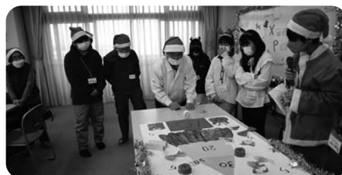
狙うは高得点!クリスマスツリーゲーム