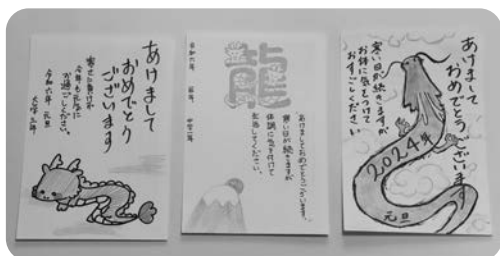
メンバーが作成した年賀状

12月9日(土)には、町内のひとり暮らし高齢者の方を招いてクリスマス会を開催しました。メンバーで考え準備したクリスマスツリーゲームや福笑いなどのレクリエーションを行い交流しました。去年はコロナにより中止になっていたため、久しぶりに顔を合わせ楽しい時間を過ごすことができました。