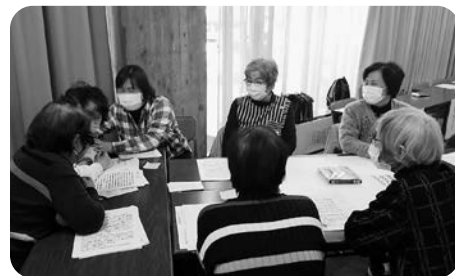
皆さんで意見を出し合いました

参加者からは「認知症の方とお話しながら、寄り添っていきたい」などの感想があり、認知症の方と家族を地域で支えることの大切さを再確認する講座になりました。