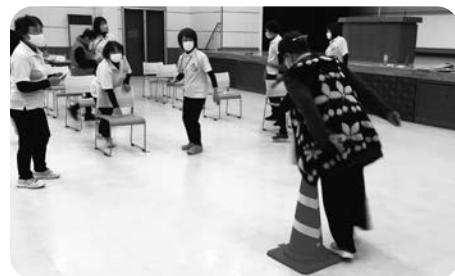
介護の日フェアでのチェック会