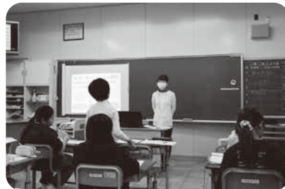
気づきや感想を発表しました

11月2日(土)下羽栗小学校で行われた「くり勉スペシャルDAY」で、「認知症サポーター養成講座」を開催し、15人の「認知症 ジュニア Jr.サポーター」が誕生しました。講座は高齢者施設「グッデイすぎない」の職員と一緒に、認知症の理解や対応の仕方、冊子や絵本を使いながら施設について学びました。講座終了後には、オレンジリング、認知症 ジュニア Jr.サポーターバッジを配布しました。さらに、地域の方により手作りされた認知症サポーター公式マスコット「ロバ隊長」のオリジナルストラップも配布しました。児童たちからは、「家族にも認知症について学んだことを伝えたい。」などの感想がありました。