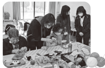
楽しく話をしながらマフづくり!

11月29日(金)松枝交流センターでケアマネジャーCaféを開催しました。ケアマネジャーCaféは、近隣のケアマネジャー同士の交流を目的とし開催しています。今回は、NPO法人ひだまり創の「つくるんCafé」も同時に開催し、地域でマフづくりを行うボランティアの活動を見学しました。地域活動をケアマネジャーに知ってもらえる良い機会となりました。今後も定期的開催していきます。