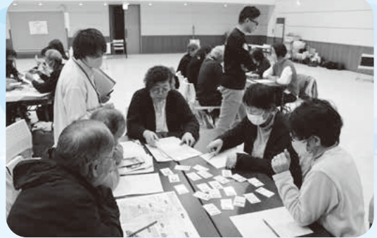
ボランティアを適材適所につなぐマッチングを体験!

災害ボランティアセンターとは、大規模災害時、被災された方と全国各地から駆けつけた災害ボランティアをつなぐ役割を果たします。災害が起きた際は本会と地域の方と協力して設置・運営ができるよう日ごろから大規模災害に対する備えを行っていきます。