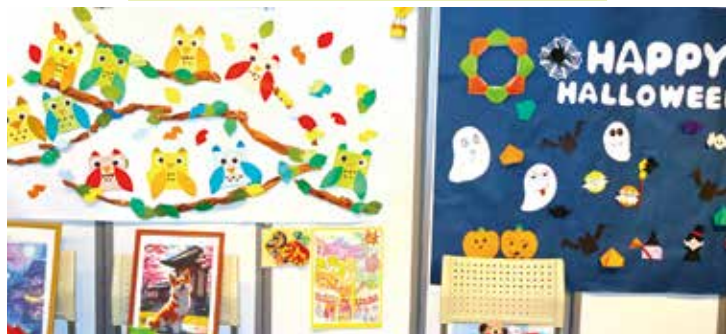
松波総合病院介護老人保健施設