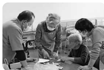
折り紙でサンタづくり！真剣です！