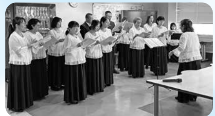
素敵なハーモニー♪

なお、「ボランティア活動をしてみたい」「ボランティアに来てほしい」などのご相談がありましたら、お気軽に本センターまでご相談ください。