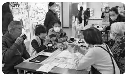
認知症家族会の方も参加！ 認知症についても学びを深めています。