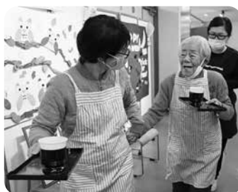
一緒にコーヒーを運びましょう♪