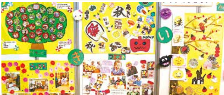
グッデイすぎない