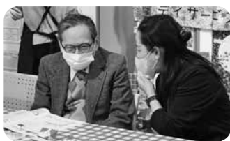
サポート医からのアドバイス

認知症の方や家族、地域の人など、 誰もが気楽に集える場 です！ 交流や相談ができ、認知症への理解を深めることができます。