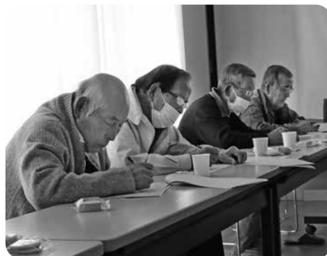
えんがわの会での測定会

脳元気測定会はサロンなどの地域の集まりにも出張可能です。毎年、測定会を実施している集いの場もあります。定期的に測定することで、ご自身の認知機能の変化を確認できます。興味のある方は本センターまでお問い合わせください。