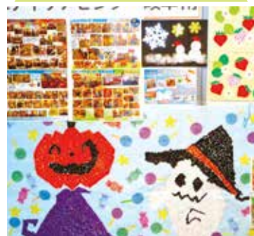
ニチイケアセンター 岐阜南