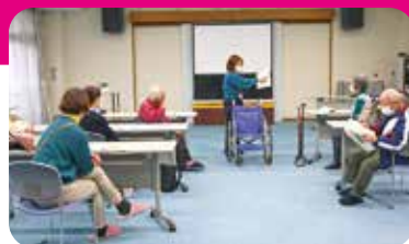
昨年度の養成講座

申込 1月28日(水)までにお電話または上の申込フォームにてお申し込みください。 ※原則、初めて参加される方のみ参加申込を受け付けます。 2回以上参加された方に修了証をお渡しします。 なお修了者には今後笠松町内で自主的なボランティア団体として活動している「小さな手助け笠松」などを紹介します。