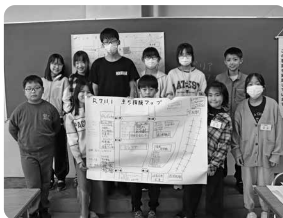
みんなで完成させた「車いすまち探検マップ」

体験後には「自分が思った以上にバリアがあって過ごしにくかったから自分ができることはやろうと思った」などの意見があり、町内のバリアフリーを学びながら助け合いの大切さを感じることができました。